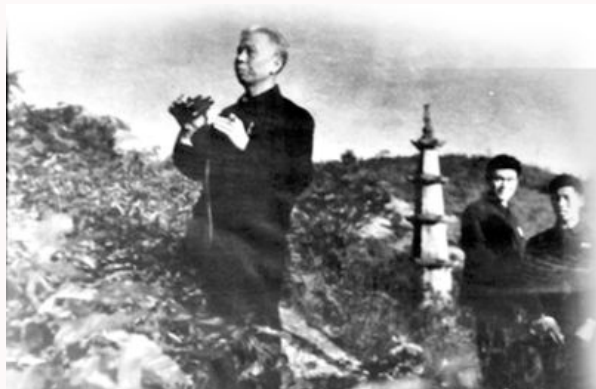
1961年，刘少奇在天华调查。